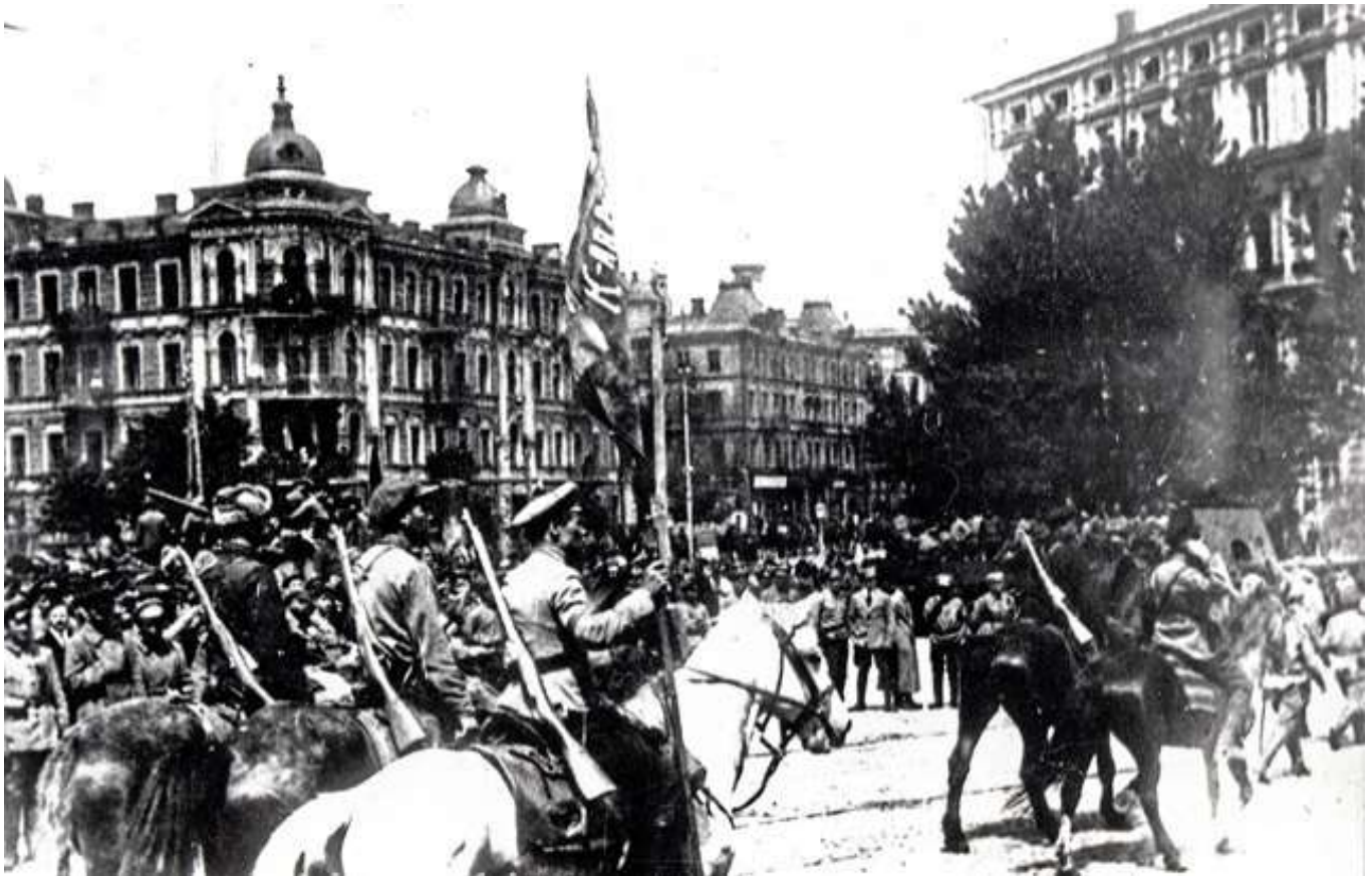
Het Rode Leger treedt Kiev binnen in 1920.

Het vormen van de Russische identiteit speelde een belangrijke rol in deze periode. Poetin deed dit op een constructieve manier: met het merendeel van zijn verwijzingen beoogde hij een Europese Russische identiteit te benadrukken en voorbeelden hiervan uit het verleden te prijzen.