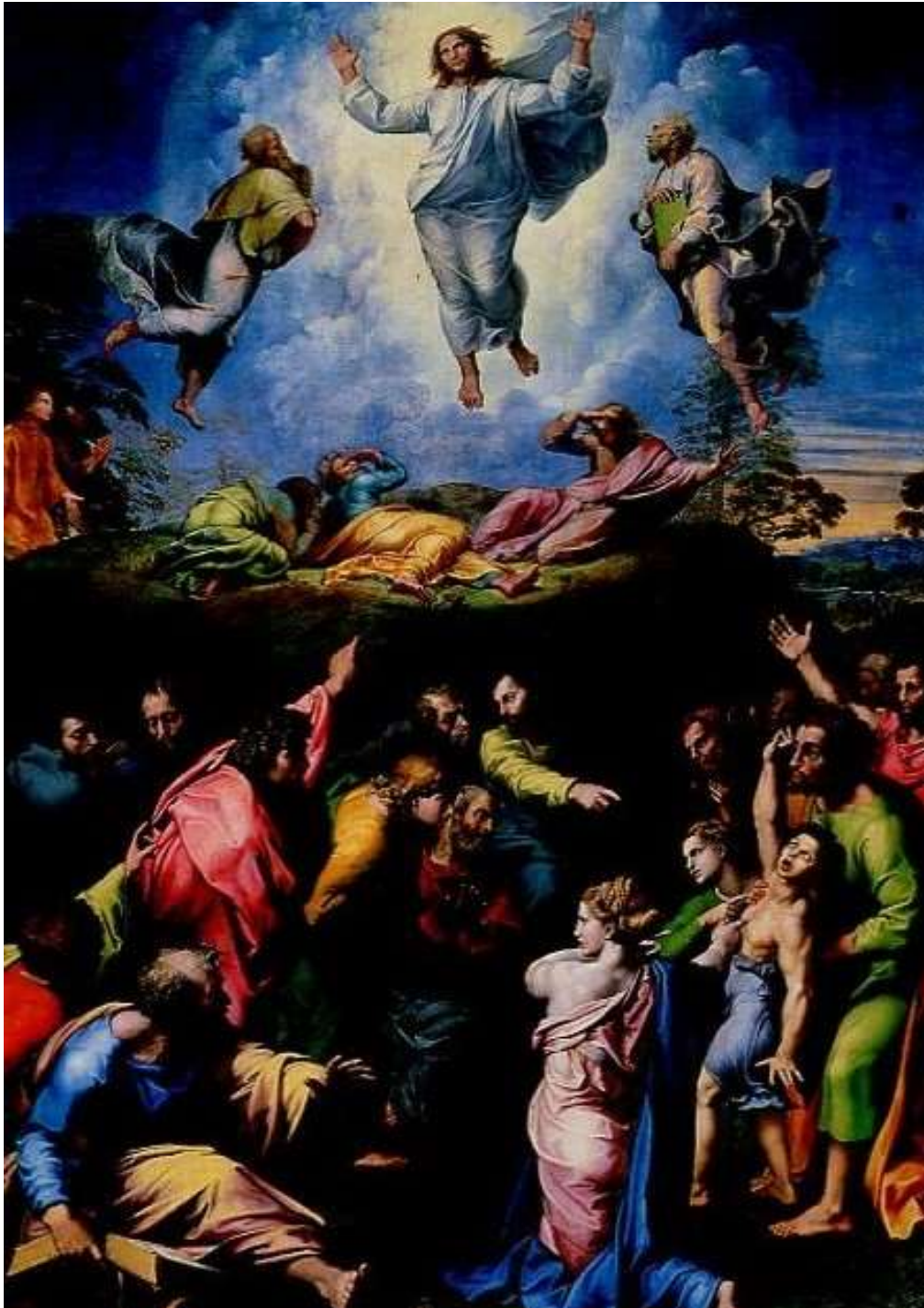
DE VERHEERLIJKING VAN CHRISTUS OP DE BERG THABOR (RAFAEL) Links van Christus Johannes de Doper-Elia. Rechts van Christus Mozes. Onder Christus, half slapende, Petrus, Johannes en Jacobus Zebedeus.

van de aankomende zware martelingen en was 'bang' dat zijn lichaam het te vroeg zou begeven. Alles zou voor niets zijn als Hij niet aan het kruis zou sterven! De apostelen slapen. Ieder is tijdens de verzoeken alleen! Christus weerstaat Ahriman en Lucifer, maar Hij zweet bloed! Vrijdag wordt Hij gevangen genomen en beginnen de overige martelingen. Onder het kruis stonden Johannes de evangelist (Lazarus-Johannes), Maria de moeder van Jezus en Maria Magdalena. Zij allen hadden voldoende geadelde zielenvermogens om tijdens de meest intense gebeurtenis in de kosmos, de kruisiging, 'wakker' te zijn.