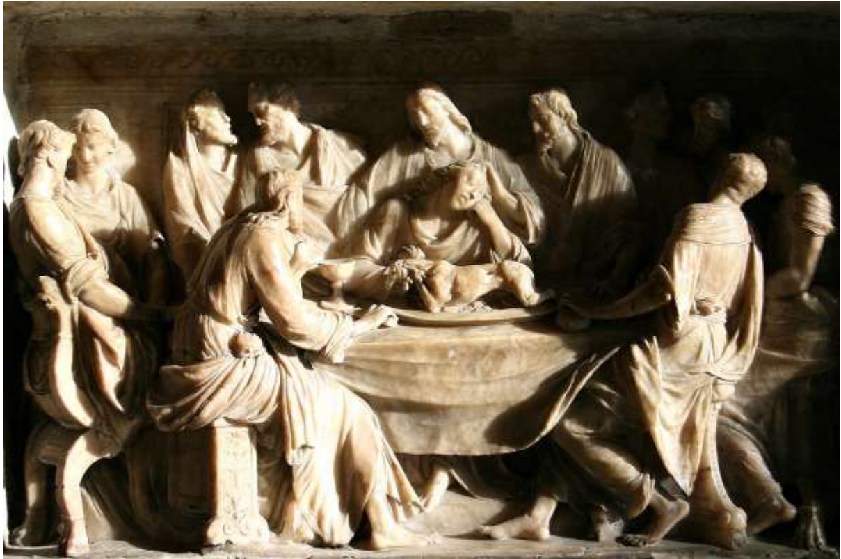
HET LAATSTE AVONDMAAL MET AAN DE BORST, RECHTS VAN CHRISTUS, JOHANNES DE EV.