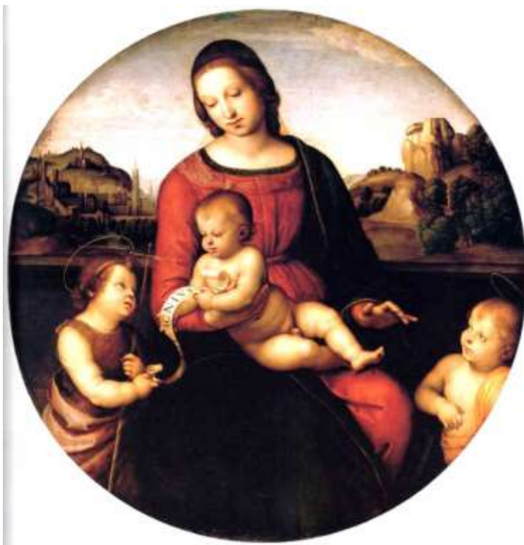
Salomonische Jezus / Nathanische Jezus / Johannes (de latere doper)

Rafaël schilderde op zijn 'Madonna del Duca di Terranuova' Maria met drie kinderen. Het kind links van Maria stelt Johannes de Doper voor. De 2 overige kinderen zijn de Jezusknappen.