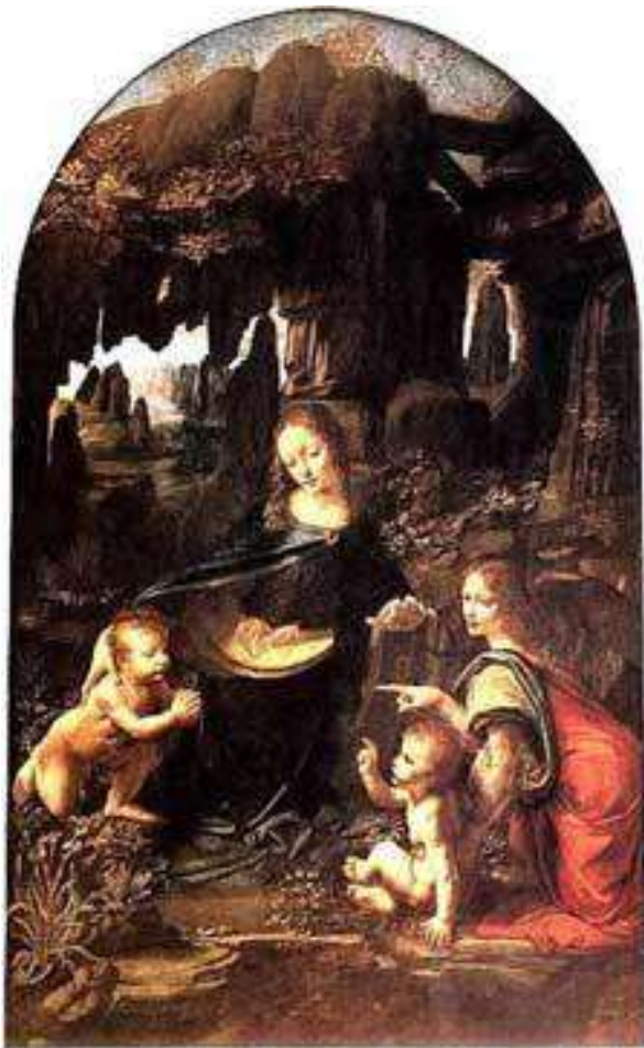
Madonna van de Rotsen (1495) geschilderd door Leonardo da Vinci